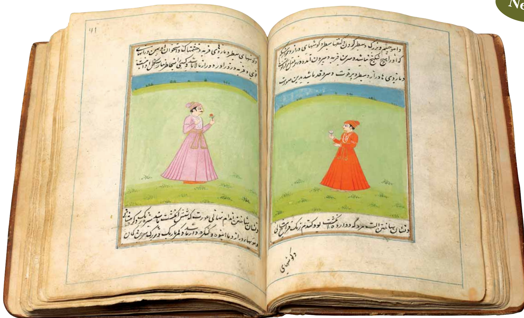
"A treatise in which poetry, eroticism and tempo come together"