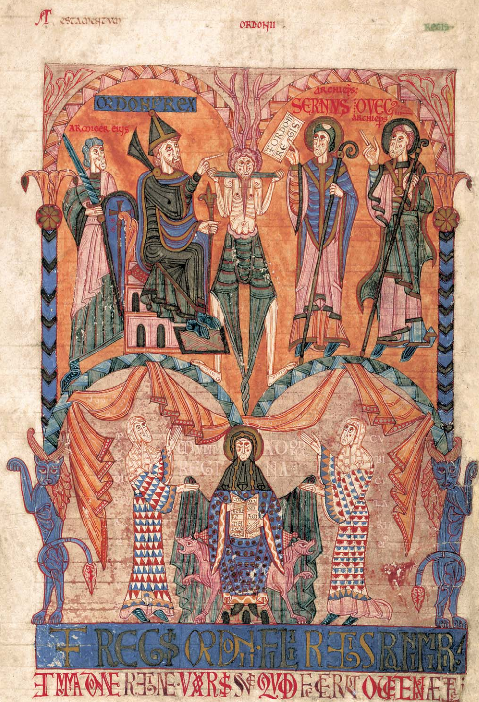
Testament de Ordoño I, f. 80