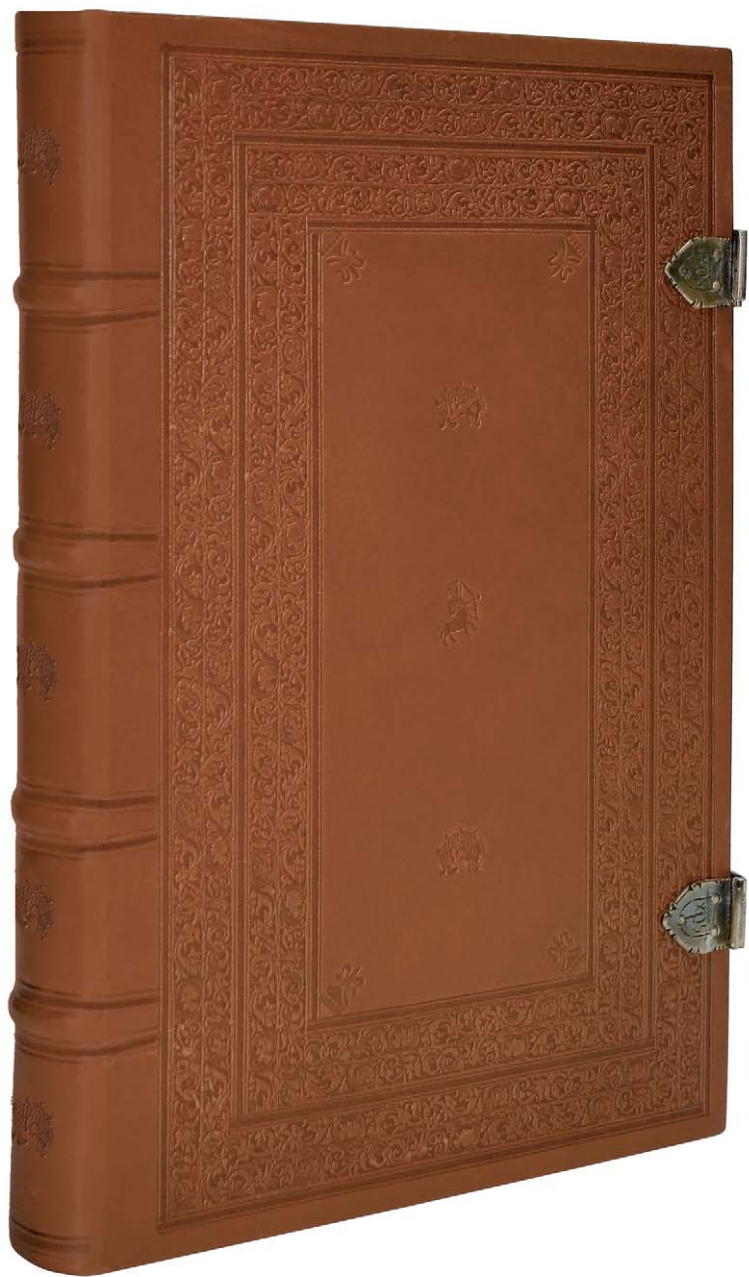
Le codex est relié en cuir marron avec des décorations à sec en forme de petits poissons, de légumes et d'un Sagittaire. Deux fermoirs où sont gravées les lettres «xps» renferment les pages.